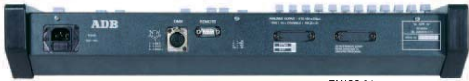
TANGO 24 - вид сзади